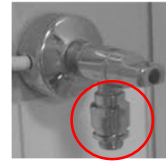
Kuva 2. Pyykinpesukoneen imusuoja