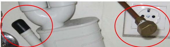
Kuva 1. Astiainpesukoneen messinki- ja muovitulppa